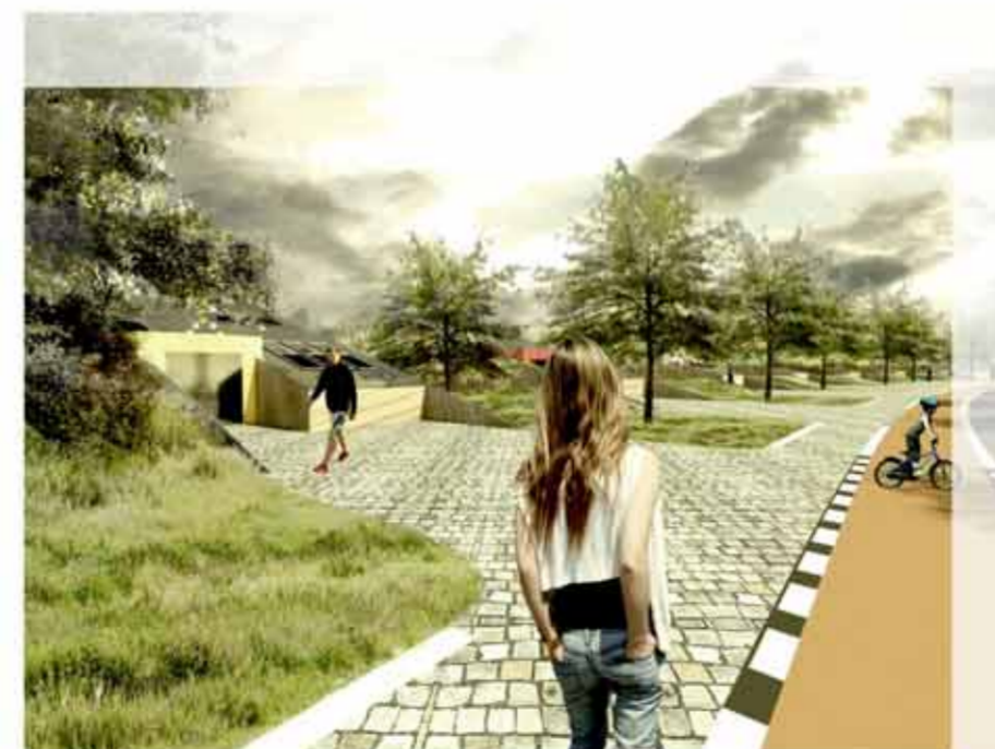
NOVÁ zástavba domů FISH

Mou snahou bylo využít maximálně celý půdorys domu, při zachování jednoduchosti dispozice. 1NP je řešeno jako obytný prostor, ve kterém se nachází obývací pokoj se schodištěm, kuchyní a jídelnou. Dále spíž, koupelna s WC a šatna, ve které je umístěno technické zařízení domu. Důležitý prvek 1NP je závěsná terasa. V 2NP se nachází hlavní vstup do domu, zádveží a klidová část. Ta zahrnuje chodbu, WC, dětský pokoj a ložnici s koupelnou.